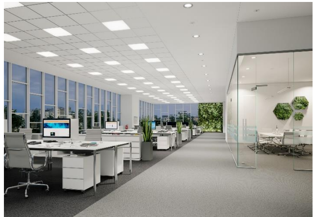
Unas instalaciones operadas desde la plataforma VIVARES DALI.

LEDVANCE pone al servicio de sus usuarios otra alternativa: VIVARES DALI. Se trata de un sistema de gestión de la luz moderna y eficiente que es compatible con el Internet de las Cosas (IoT). El sistema conecta las luminarias cableadas mediante protocolo DALI a